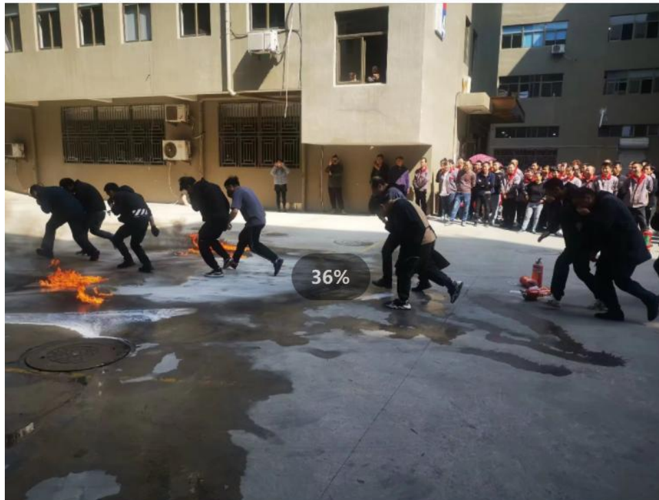
公司组织的消防演练